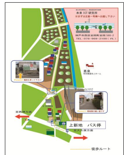
バス停からの徒歩MAP