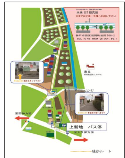
バス停からの徒歩MAP