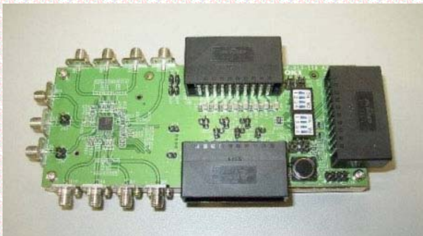
MMICを搭載した高周波送受信モジュール写真(インパルス方式)