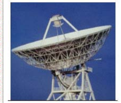
Jodrell Bank Observatory (マンチェスター大学) Cambridge 32mパラボラアンテナ(英国)