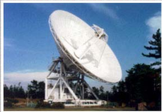
NICT鹿島宇宙通信研究センター 鹿島34mパラボラアンテナ(日本)