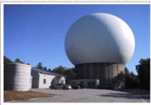
Haystack Observatory(MIT) Westford 18mパラボラアンテナ(米国)

観測に参加するパラボラアンテナ (これらの他、オランダ、スウェーデンの アンテナが参加)