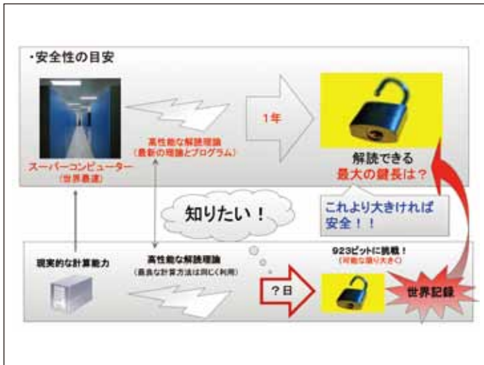
図3●ペアリング暗号の安全性評価(2)