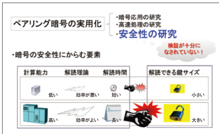
図2●ペアリング暗号の安全性評価(1)