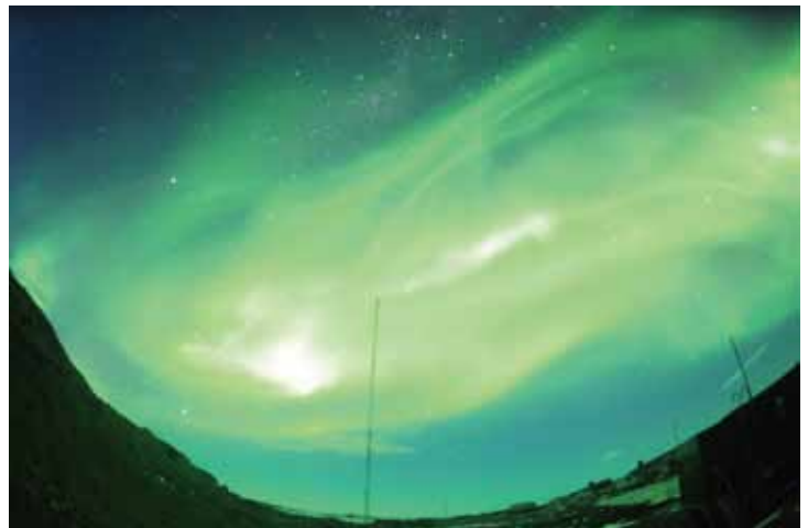
図3 南極昭和基地の電離圏観測用デルタアンテナとオーロラ