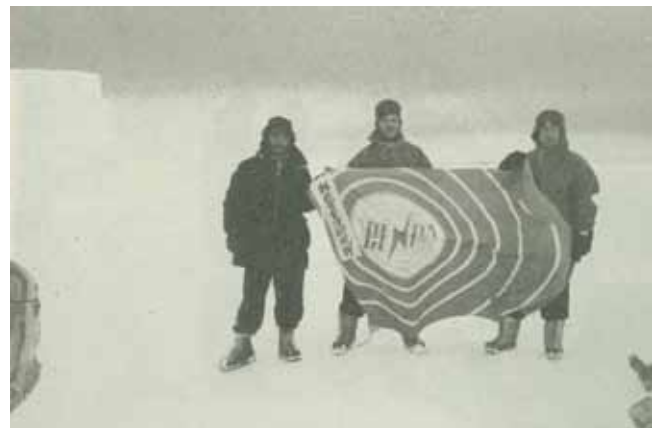
図1 第1次南極観測隊に参加した電波研究所隊員 (「南極電波観測の二十五年」より)

1957-1958年の国際地球観測年(IGY)の活動の一環として幕を開けた日本の南極観測において、電波研究所(現NICT)は黎明期から継続的に隊員を南極に派遣し、電離圏観測を実施してきました(図1)。第1次隊では、南極観測船「宗谷」の船上にイオノゾンデとアンテナを設置し、南極及びその移動中の航路において電離圏観測を実施しました。昭和基地での定常観測は第3次隊(1959年)からスタートし、それから毎回南極に隊員を派遣して定常観測を継続しています。この間、イオノゾンデを用いた電離圏の垂直観測に加え、オーロラレーダ、リオメータ *1 、短波電界強度測定、VLF電波測定等、様々な観測を昭和基地において実施し、オーロラ粒子降り込みの2次元分布特性や太陽活動サイクルにおける電波オーロラの発生頻度特性の解明などの成果を挙げてきました。