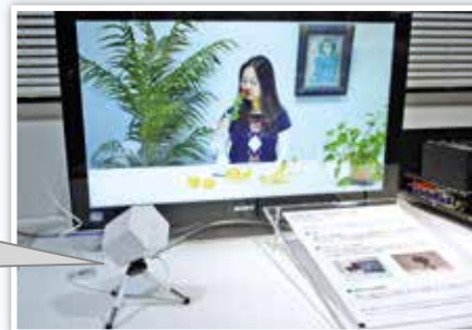
アロマシューター