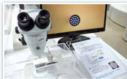
顕微鏡でしか見えない19コア光ファイバー