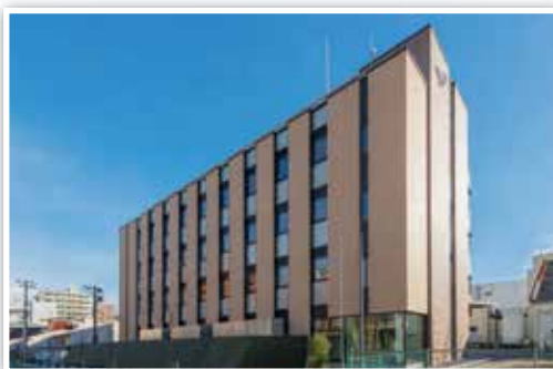
耐災害ICT研究センター外観(東北大学片平南キャンパス内)