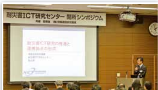
耐災害ICT研究センター開所シンポジウム