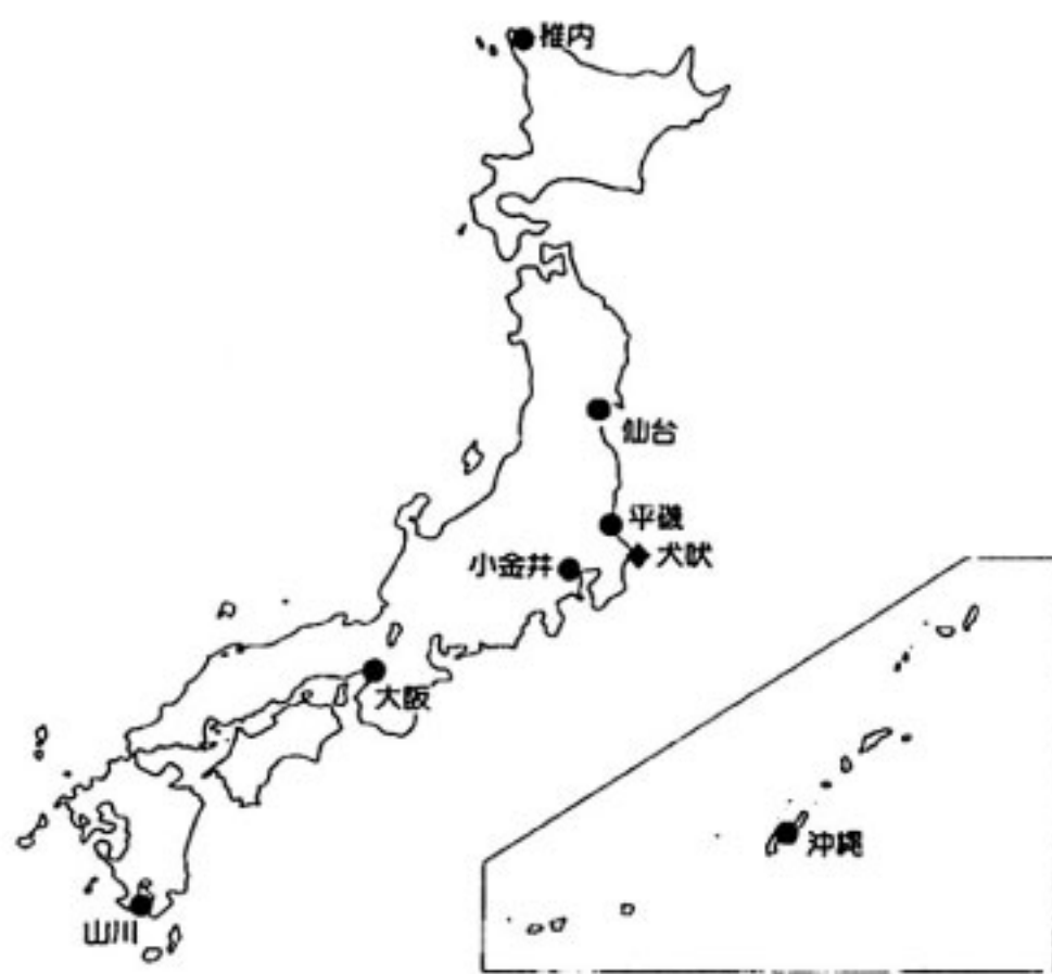
第3図 テレホンサービス配置図