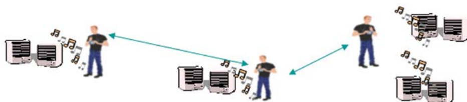
移動した時でも、スピーカーを切り替えて使うことも可能