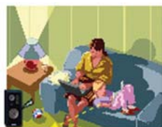
ノートパソコンから、近くのスピーカーに転送

これからの時代は、家庭の各部屋にインターネットの情報コンセントが設置され、全ての家の中の電化製品がネットワークに接続されるユビキタス時代が到来することが想定されます。接続される機器は例えば、エアコン、電子レンジ、テレビ等ほとんど全ての家庭電化製品です。そして音響としてネットスピーカーを各部屋に設置することで、ステレオやテレビをはじめとする各種 AV 機器の音声出力としたり、また部屋を移動しても別の部屋のネットスピーカーで引き続き音声を聞くことや、各部屋間同士の会話用のためのインターホンとしても使うことができるでしょう。さらに一方事業所や学校や病院等では、緊急時の一斉放送や個別呼び出しまたはこれに対する応答の受信が、従来の放送用配線が無くても、インターネットコンセントがあれば、簡単にインターネットスピーカーの増設・取り外し等の変更がソフトウェアの変更だけで簡単にできます。このように、アイデア次第でいろいろな使い方ができるインターネットスピーカーが各家庭に普及する日はそれほど遠くないかもしれません。