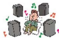
複数のスピーカーを同時に利用することも可能