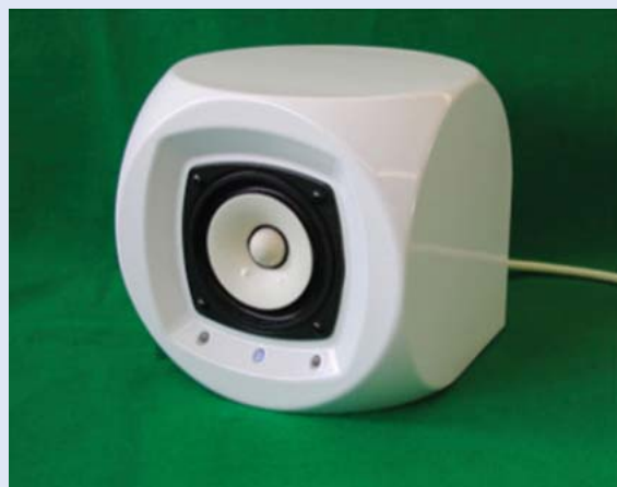
インターネットスピーカー外観

は せ がわ み き お もり がわ ひろ ゆ き 長谷川 幹雄、森川 博之、 いの う え ま す ぎ Bandara Udana、井上 真杉