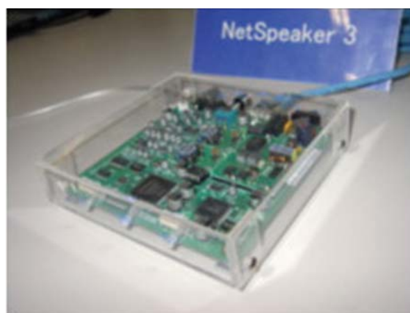
インターネットスピーカー (スピーカー無しタイプ)