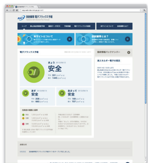
図1 静止軌道上の電磁環境を経験モデルを用いて予測し、衛星帯電など障害を引き起こす危険性を検証するモデルを開発。数日先までの予測を行うモデルを開発。従来のモデルよりも高い予測精度が得られることを確認。Webによる外部への情報公開を開始。本予測情報はJAXAへ提供。

第2番目のカテゴリとして、太陽と地球の間で重力の釣りあう点（ラグランジュ点）に浮かぶ探査機“ACE”による太陽風の直接観測を行っている。ACEでは太陽風の速さ、濃さ、温度とともに磁場の向きと強さを観測し、太陽風が地球に到達するおよそ1時間前に地上にその情報を送っている。NICTは平成