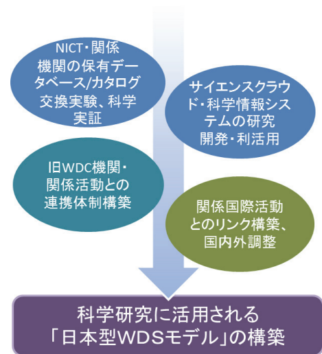
図 2 当面の WDS 関連成果目標の概念図

平成 24 年度は、後述するサイエンスクラウド上の大規模ストレージでデータベースの一部移植・稼働実験を行うとともに、異分野データのカatalog作成や相互連携解析の試行ツールの開発を通じて旧 WDC 機関との連携体制構築作業を進めつつ新たなデータ処理手法の研究開発を行った。さらに国際連携事業としての WDS を通じた成功目標の具体化案として、旧 WDC や国内関係活動、サイエンスクラウド等の NICT の活動も含めた、全体調和的な連携の具体化方を検討した (図 2)。