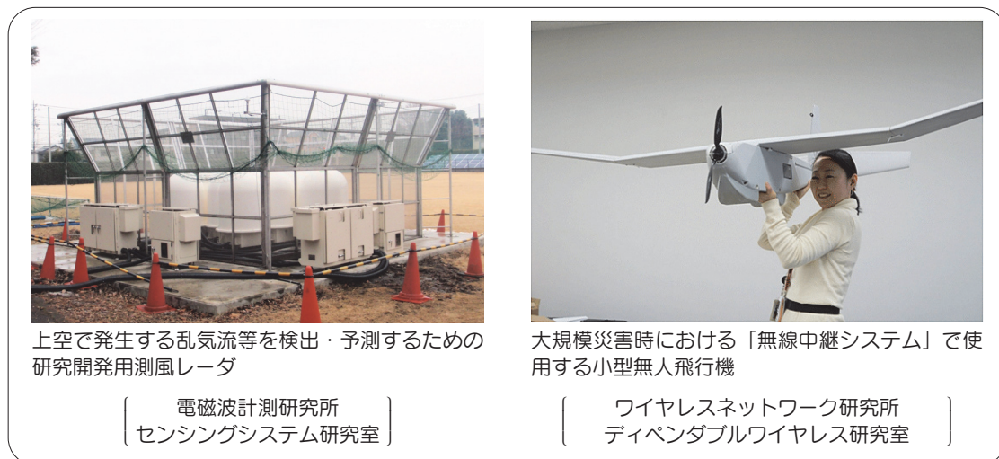
図1 開局した無線局の例

研究者等が研究計画に基づいて使用する研究用無線局を安定的に運用するため、無線局の各種申請・届出（開設、変更等）の手続き及び無線局・無線従事者の全体管理を適切に行い、研究開発の推進に努めた（実績は4.2参照）。開局した無線局の例を図1に示す。また、各種申請・届出等を、インターネットを利用した電子申請に移行し、無線局に関する各種手続きの簡素化を図った。さらに、無線従事者が無線局を適切かつ効率的に運用するための説明会を7月に開催した。