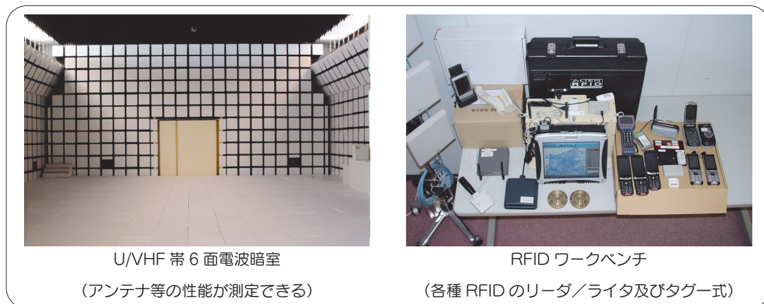
図 3 対象施設等の例

NICT が保有する研究施設等の一部について、施設等の空き時間を使って外部研究者も有償で利用できるようにする「施設等供用制度」の運用を行うことにより、産学官との研究連携を促進するとともに国内における ICT 分野の研究活動の推進を図っている。対象施設等の例を図 3 に示す。本年度は、U/VHF 帯 6 面電波暗室の利用が 4 件あった。