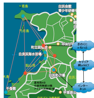
図 2 和歌山県白浜町の実験用ネットワークの構成図

(赤、青点はそれぞれ観光客と住民(1万人)を想定。観光客は主に海水浴場や海岸付近に集まっているが、地震発生直後に高台の一時避難場所もしくは自宅へ避難するシナリオを想定。バスや車による避難も想定し、渋滞の発生も再現した)