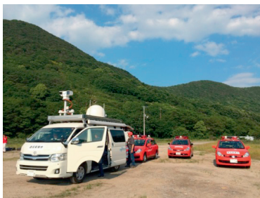
図 3 香川県坂出市での実証実験