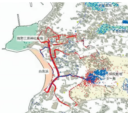
図 1 避難行動シミュレーションの結果

(赤、青点はそれぞれ観光客と住民(1万人)を想定。観光客は主に海水浴場や海岸付近に集まっているが、地震発生直後に高台の一時避難場所もしくは自宅へ避難するシナリオを想定。バスや車による避難も想定し、渋滞の発生も再現した)