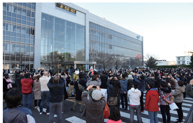
図1 うるう秒挿入イベント (1月1日/小金井本部)

7件の報道発表を行い、TV・ラジオ番組に31件取り上げられ、新聞や雑誌にそれぞれ120件、13件の記事が掲載された。また、延べ1,197名の視察・見学に対応した。1月1日に実施した「うるう秒挿入イベント」(図1)には400名超が来場し、全員でうるう秒挿入の瞬間