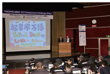
図4 プレゼンテーションの様子(起業家万博)