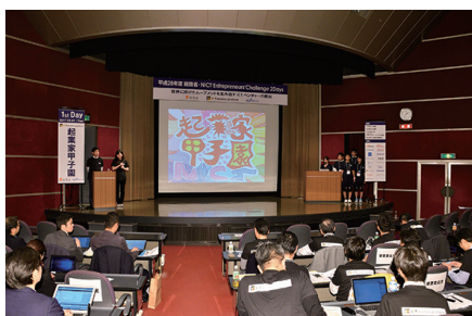
図2 プレゼンテーションの様子(起業家甲子園)

平成29年3月8日に、コクヨホール（港区）において開催した。地域の起業家応援団から推薦を受けたICTベンチャー企業及びNICT発ベンチャー企業の8社によるプ