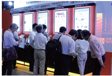
図6 Interrop Tokyo 2016