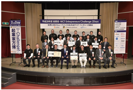
図5 発表者との記念撮影