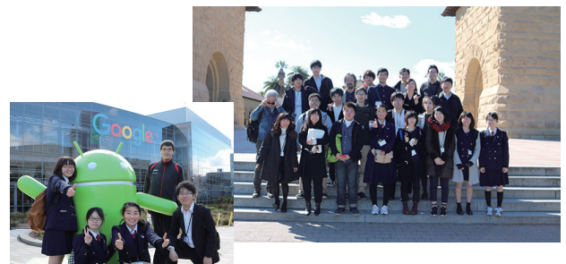
図8 シリコンバレー

地域の有望なICTベンチャーや起業家の卵を発掘・育成するため、地域の起業家応援団と連携し、キックオフ