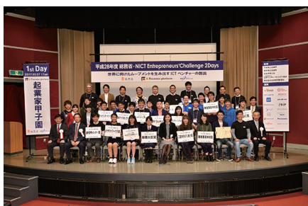
図3 発表者との記念撮影(起業家甲子園)