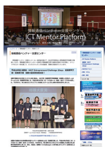
図1 情報通信ベンチャー支援センター

や西海岸発ベンチャービジネス情報の紹介など、ICTベンチャーに対して有益でタイムリーな情報を収集・提供している（図1）。