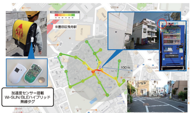
図2 IoT化自動販売機によるWi-SUNビーコン中継拡散エリアの様子

上記自動収集に頼らない実証実験としては、加速度センサーも搭載したWi-SUN/BLEハイブリッド無線タグ(平成28年度開発)から送信されるWi-SUNビーコン及びBLEビーコンが、付近のIoT無線ルーター搭載の飲料自動販売機(IoT化自販機)で検出されて、更に広く周辺に中継拡散される動作を確認した。また、IoT化自販機から見通しのきかない100~200m以上離れたエリアを走行中の車両であっても、IoT化自販機によって中継