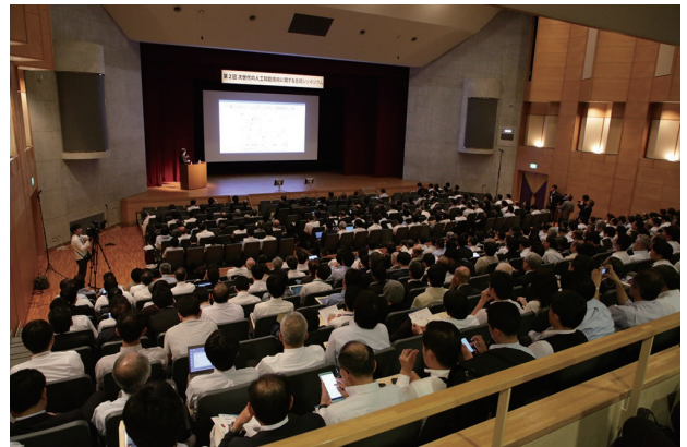
図3 「第2回次世代の人工知能技術に関する合同シンポジウム」会場内の模様

て、最近の人工知能技術の動向や、研究開発、社会実装、人材育成、データ整備、ベンチャー支援等に関して、我が国の今後の人工知能技術に関する戦略を多角的に議論するために有識者にご登壇いただき、NICTがホストとして開催した（平成28年4月に続き2回目の開催）。