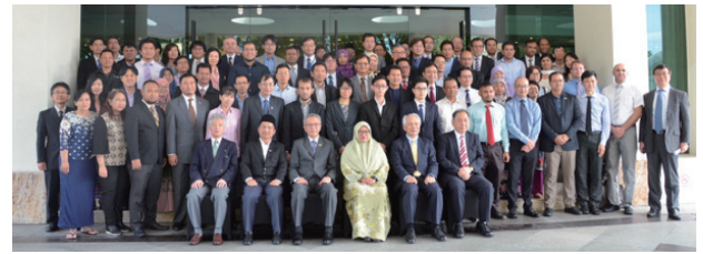
図4 ASEAN IVO Forum 2017参加者集合写真 (11月23日、ブルネイ・バンドルスリブガワン)

NICTが主導してASEAN域内の研究機関・大学等と共同で平成27年2月に設立した研究連携組織「ASEAN IVO (ICT Virtual Organization of ASEAN Institutes and NICT)」の活動を更に推進し、ASEAN加盟全10か国40機関(前年度比+10)の体制へ拡大した。その下で、共通の課題解決を目指した共同研究プロジェクト第1弾(平