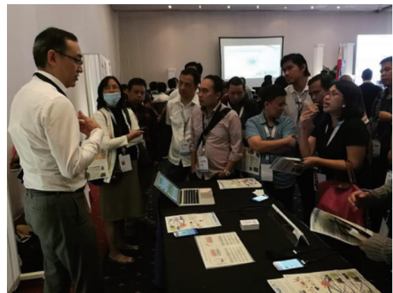
図5 ICT Disaster Response Conference 2017での動態デモ (9月21日、フィリピン・セブ)

成28年度開始、8件)と第2弾(平成29年度開始、5件)を推進した。いずれもNICTの研究成果の利活用を含むもので、延べで34機関117名が参画する大規模な研究体制となった。11月にASEAN IVO Forum 2017(ブルネイ・バンドルスリブガワン、参加109名)を開催し(図4)、共同研究提案33件の発表と議論、応募に向けたグループ形成を行った。その後、スマートな農業・養殖・観光・環境保護や情報信頼性を対象とした提案募集に対し33件の応募があり、ASEAN IVO運営委員会の審議を経て6件の採択を決定した(平成30年度から開始)。