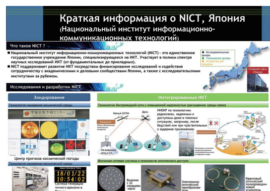
図2 展示会で使用したロシア語で記載したNICT概要紹介パネルの一部