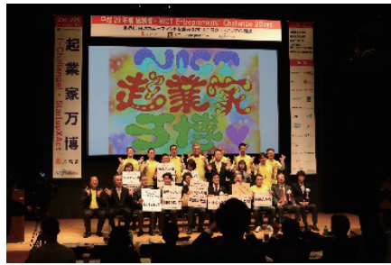
図3 発表者との記念撮影（起業家万博）