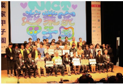
図2 発表者との記念撮影（起業家甲子園）