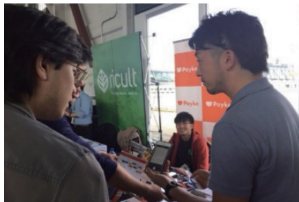
図5 展示会（TechCrunch DISRUPT SF 2017）