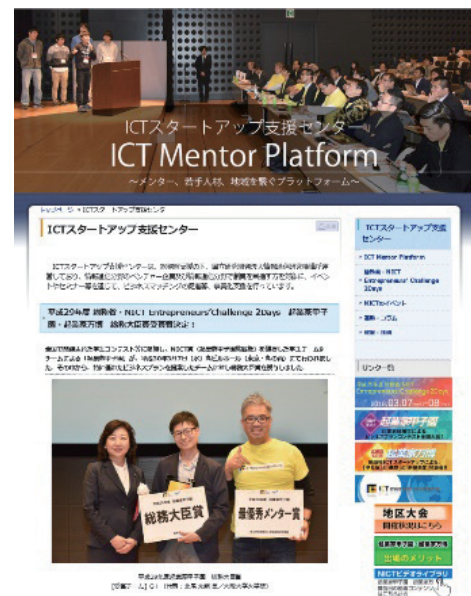
図1 情報通信ベンチャー支援センター

平成30年3月7日に、丸ビルホール（東京・丸の内）において開催した。当日は、全国の大学や高専のイベント等から選抜した学生チーム9チームによるプレゼンテーションが行われ、総務大臣賞に大阪大学大学院「G-SENSE（6-pole GVS）内蔵ヘッドホン」、審査委員特別賞に長岡工業高等専門学校「Tanboo～農業の常識を変える格安IoTシステム～」と沖縄工業高等学校「つみ