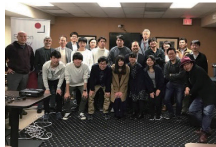
図6 シリコンバレーブートキャンプ