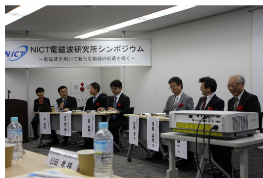
図1 電磁波研究所シンポジウムの模様

「次世代安心・安全ICTフォーラム」は、ICTを利用した安心・安全社会の実現を目指した取組を産学官の連携により推進することを目的として平成19年に設立された。当研究所では平成22年度からこの活動に参画するとともに、事務局機能も担当している。平成31年2月8日に「災害・危機管理ICTシンポジウム2019」をパシフィコ横浜にて開催し、全5件の講演に対して約90名の参加者があった。