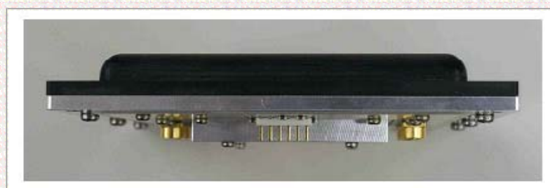
UWB短距離レーダシステムに内蔵されている薄型MMICモジュール(注4) (RFデバイス・アンテナ一体型、大きさ10×10×1 cm)の写真