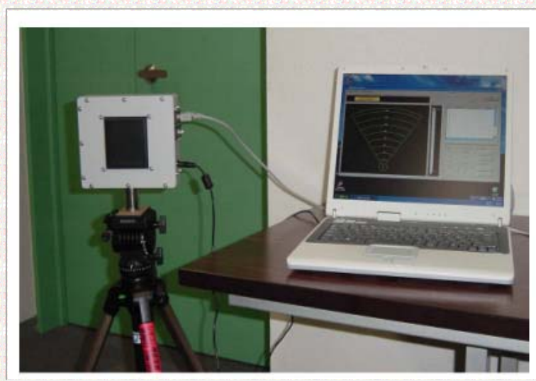
UWB短距離レーダシステムの写真 (左:レーダ本体、右:本体制御用PC)

インパルスレーダ方式の原理(パルス信号を送信して、対象物に反射して受信されるまでの時間差から距離を算出する)