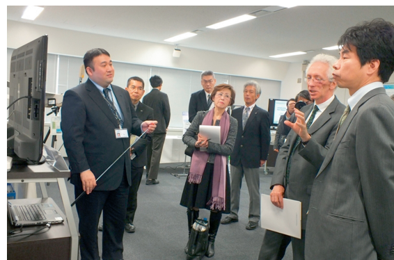
図 4 ランシー ITU-R 局長によるホワイトスペース通信技術の視察