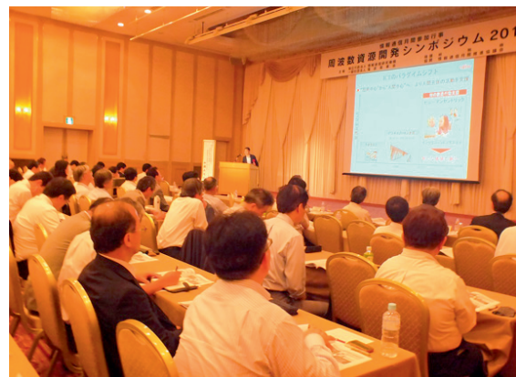
図 2 周波数資源開発シンポジウム 2014 の会場の様子