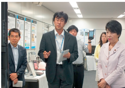
図 3 上川副大臣による UWB 測位システムの視察