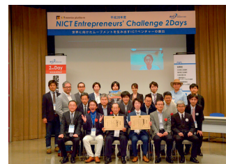
図7 発表者との記念撮影