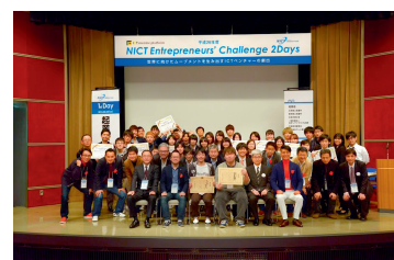
図4 発表者との記念撮影