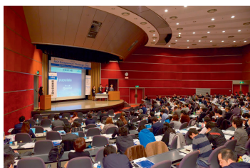
図2 プレゼンテーションの様子

平成27年3月3日に、コクヨホール（港区）において開催した。当日は、全国の大学や高専のイベント等から選抜した学生チーム11チームによるプレゼンテーションが行われ、総務大臣賞に石川工業高等専門学校「HackforPlay」、審査委員特別賞に香川高等専門学校「すくえあ」が選ばれた。また、各出場チームには、協賛企業から特別賞としてインターン権の授与等があった（図2～4）。