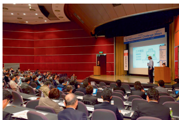
図5 プレゼンテーションの様子

によるプレゼンテーションのほか、会場内に設けた展示ブースでは、ビジネスマッチング及び製品・サービスのPRが行われた。コンテストでは、総務大臣賞に ExMedio「ヒフミル君」が、オーディエンス賞に株式会社笑農和「水稻農家向け水門管理サービス」が選ばれた。また、地域支援団体賞に福岡県 Ruby・コンテンツビジネス振興会議が選ばれた(図5～7)。