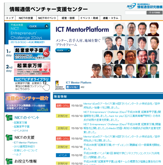
図1 情報通信ベンチャー支援センター

インターネット上に開設したWebページ「情報通信ベンチャー支援センター」< http://www.venture.nict.go.jp/ >において、NICTの支援施策や全国のベンチャー助成施策の紹介など、情報通信ベンチャーに対して有益でタイムリーな情報を収集・提供している（図1）。