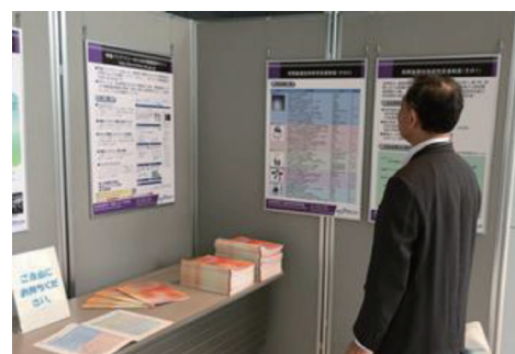
図4 NICT オープンハウスにおける成果の展示