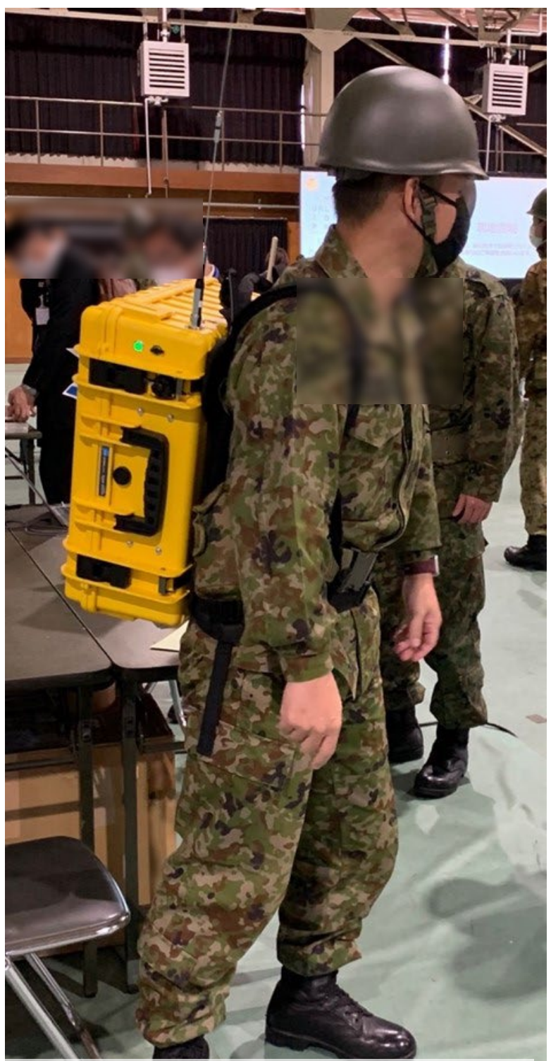
2021年11月25日 帯広駐屯地での展示 にて撮影