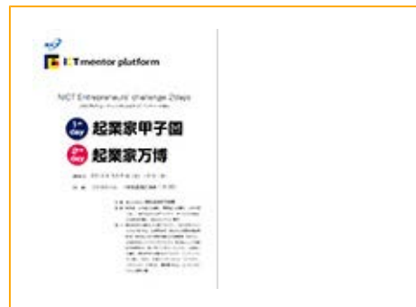
NICT Entrepreneurs' Challenge 2Days パンフレット

『起業家万博』は、ICTを用いて豊かな世の中を目指そうと取り組む全国各地のICTベンチャーが、工夫を凝らした新規事業(商品・サービス)を発表し、事業提携・資金調達・販路拡大・人材確保などのビジネスマッチングにチャレンジするイベントです。