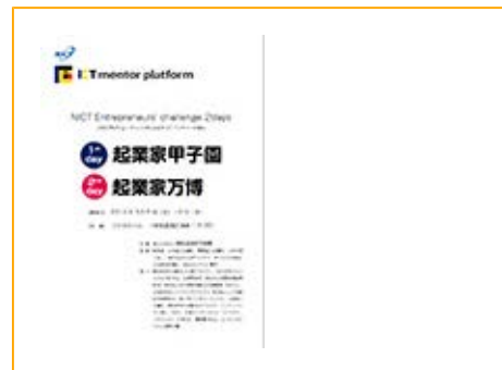
NICT Entrepreneurs' Challenge 2Days パンフレット

『起業家万博』は、ICTを用いて豊かな世の中を目指そうと取り組む全国各地のICTベンチャーが、工夫を凝らした新規事業(商品・サービス)を発表し、事業提携・資金調達・販路拡大・人材確保などのビジネスマッチングにチャレンジするイベントです。